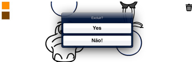
Figura 11: Confirmação da tarefa excluir através de botões

Tarefa 8 – nenhuma criança soube salvar o desenho. O ícone da caixa de entrada não foi reconhecido para esta tarefa. Segundo informação fornecida pela professora regente da turma com a qual a avaliação foi realizada, o comando “salvar” não é reconhecido pelas crianças dessa faixa etária, sendo alterado para “guardar”. Mesmo com a troca semântica do termo, nenhuma criança que participou da avaliação soube realizar essa tarefa, pois não reconheceu o ícone proposto pelo aplicativo. Foi sugerido por uma delas, alterar o desenho para um cesto, pois é o local onde ela guarda seus brinquedos. Esta função também apresenta o problema de reconhecimento dos botões para confirmação da tarefa, sendo três opções de escolha: desenho, desenho e fundo e cancel . Como as crianças nessa faixa etária ainda não foram alfabetizadas, a execução correta da tarefa fica comprometida.