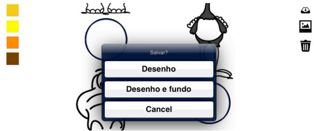
Figura 13: Confirmação da tarefa salvar através de botões

Tarefa 9 – ainda segundo informações da pedagoga, para as crianças dessa faixa etária a carta não faz parte de seu universo, já que estamos trabalhando com crianças da Geração Alfa, ou seja, nascidas em meio ao mundo digital, onde o envio de cartas pelo correio é cada vez mais escasso. Das seis crianças que participaram da avaliação, apenas duas reconheceram o ícone da carta como ferramenta de envio. Isso se deu devido ao conhecimento prévio da ferramenta de e-mail no ambiente familiar. Esta tarefa também exige a confirmação através dos botões desenho, desenho e fundo e cancel .