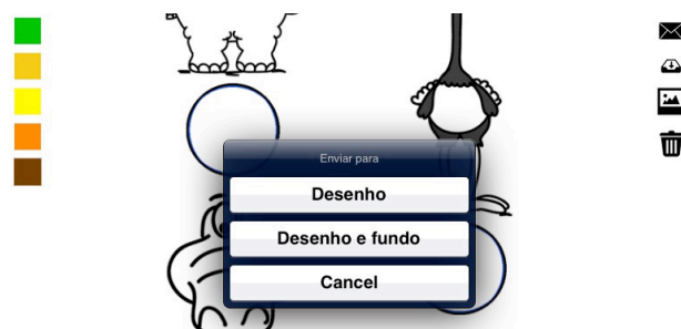
Figura 15: Confirmação da tarefa enviar através de botões

Tarefa 10 – nenhuma criança participante soube aplicar um fundo ( background ), tampouco se interessou em clicar no ícone proposto para esta tarefa, ficando a mesma inutilizada.