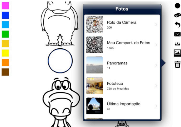
Figura 17: Tarefa inserir fundo, realizada através do ícone “background”