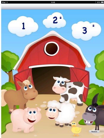
Figura 4: Tela inicial. Não apresenta indicação das atividades propostas pelo aplicativo.