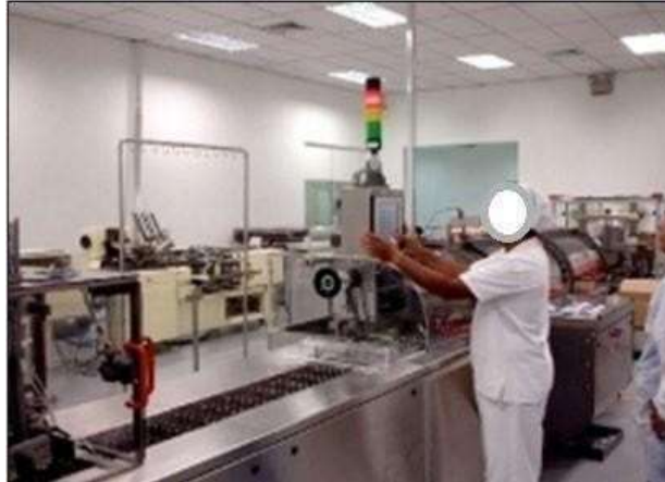
Figura 4: Momento de ocorrência de variabilidade incidental no processo e regulação.

Ainda segundo este autor, as variabilidades podem ser de três tipos: Técnicas, organizacionais e Humanas. Por variabilidade técnica se entende aquela que está ligada ao processo produtivo em si, ou seja, que a sua origem não esteja ligada às características humanas da produção. Assim, as variabilidades normais e incidentais são quase sempre técnicas e, como tais, podem ser tratadas. Existem, entretanto as variabilidades organizacionais, devido ao fato de que certos procedimentos se ajustam e novas instruções normativas, provisórias ou permanentes, passam a vigorar (muito frequentemente isto ocorre em nível de relatórios e indicadores). Outra manifestação nesta categoria se dá no nível de escala de plantão e substituição de colaborador na equipe, devido ao absenteísmo, falta, rotatividade etc. Existem também as variabilidades humanas, conforme Figura 5, que se subdividem em: variabilidade interindividual e intraindividual (dão conta das diferenças entre pessoas, homens/mulheres; jovens/idosos, altos/baixos, personalidade, competência etc.).