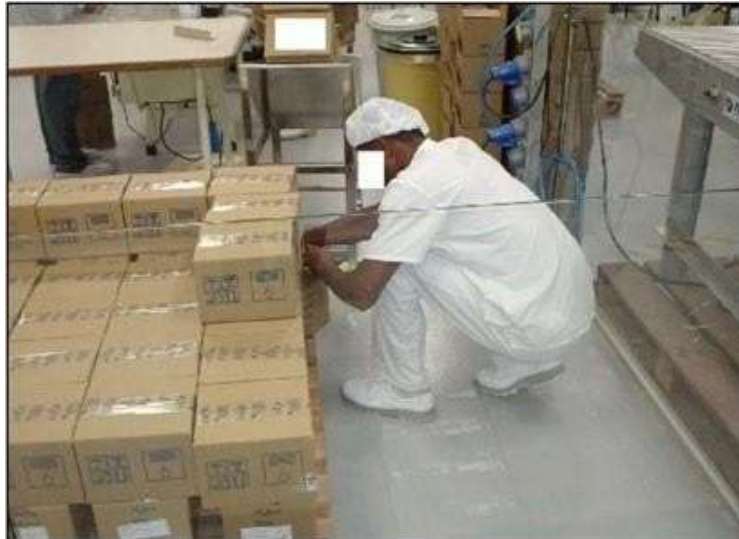
Figura 5: Momento de ocorrência de variabilidade humana no processo e regulação.

Infelizmente, as organizações ao determinarem suas estratégias e estruturarem os seus processos de trabalho, ainda admitem o taylorismo como forma de obtenção dos melhores resultados, em que a equidade da linha de produção determina a produtividade. Esquecem-se, porém, de que inserida dentro de qualquer atividade, está a variabilidade inerente aos comportamentos dos colaboradores no desempenho de suas funções produtivas, ou seja, as variações intraindividuais, que é determinada pela realidade operativa, ou seja, os modos operatórios, aplicados na execução da tarefa e, não por sua prescrição (Wisner, 1976).