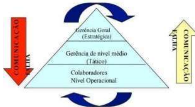
Figura 3: Contexto da comunicação na farmoquímica

princípios deontológicos ficam restritos aos seus gerentes. Os conhecimentos fornecidos por parte da gerência aos colaboradores sobre as políticas da farmoquímica são restringidos ao desenvolvimento das tarefas prescritas pelos colaboradores, isto é o que foi evidenciado no setor de embalagens.