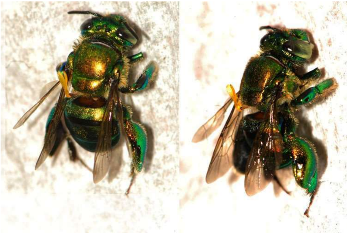
Figura 6. Especimen de Euglossa sp. colectada en el Valle de los Manduriacus, cargada polinios de Gongora sp. - Orchidaceae

De los especímenes colectados solamente uno del género Euglossa se encontró con polinios el que interactúa con el género Gongora de la familia Orchidaceae. (Figura 6).