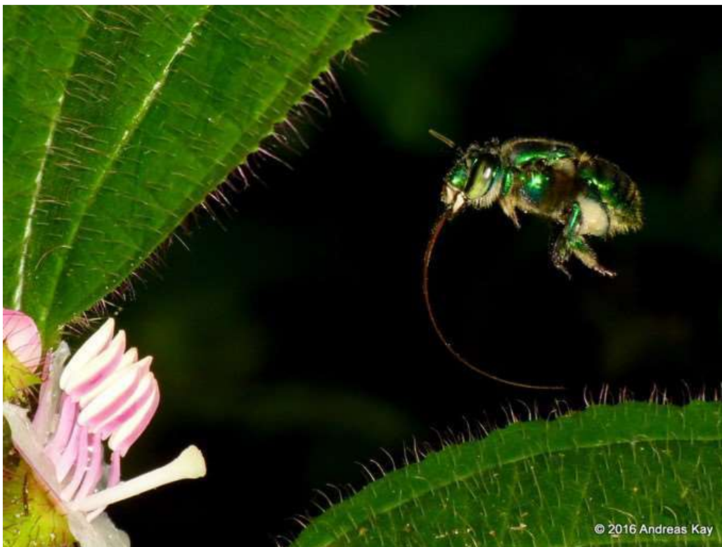
Fotografía: Andreas Kay. 2016

Se diferencian de sus parientes por su estilo de vida solitario, no tienen reina, ni producen