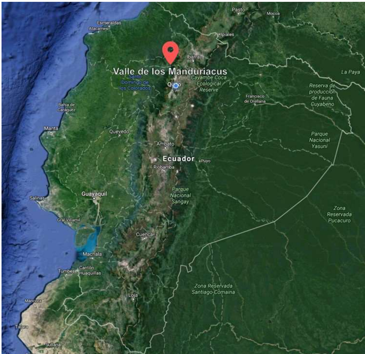
Figura 5 Ubicación del área de estudio. Valle de los Manduriacus, Imbabura - Ecuador

Esta zona se extiende entre los 300 y 1400m de altura, de acuerdo al Sistema de Clasificación de los Ecosistemas del Ecuador Continental [12], se ubica en el Bosque siempreverde piemontano de Cordillera Occidental de los Andes (BsPn01). Los muestreos se realizaron en las coordenadas 0.225555^{\circ} N, 78.866822^{\circ} O, a una altura de 545 m (Figura 5).