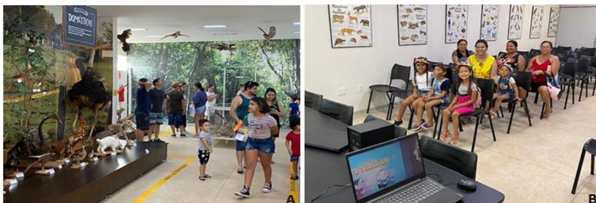
Figura 3. Museu de História Natural. Em A, visitação do público junto aos animais taxidermizados; B, sessões de vídeos educativos tratando diversos temas ambientais.

Quanto às ações ambientais abordadas nas sessões de vídeos, o município de Itapira apresenta inúmeras ações de EA extraclasse. Martelli e Alvarenga (2022) relatam um estudo com visitas de crianças e adolescentes junto ao Viveiro de Mudas vinculado à Secretaria de Meio Ambiente e posteriormente à Nascente Municipal Modelo localizada numa área pública no bairro Parque Residencial Braz Cavenaghi demonstrando a importância das matas ciliares no que diz respeito a proteção dos corpos d'água e proteção de processos erosivos, cultivo de plantas – da semente a muda formada, bioma onde o município está inserido dando uma ênfase à vegetação nativa e os aspectos negativos das espécies exóticas invasoras, dentre outras informações pertinentes ao tema.