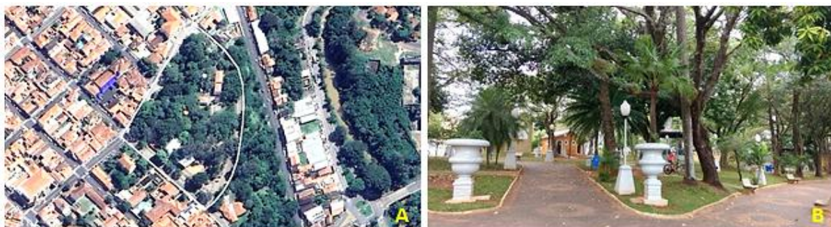
Figura 1. Parque Juca Mulato. Em A, imagem aérea do Parque, sendo composta por inúmeras árvores; B, interior desse parque.

Durante as atividades, a Secretaria de Agricultura e Meio Ambiente (SAMA) aproveitou o espaço do Museu de História Natural, onde está inserido o Centro de Educação Ambiental, para incentivo das pessoas que passaram por esse local sobre a importância da realização do plantio de mudas de árvores nos passeios públicos e áreas particulares, entrega de materiais referente à posse e tutoria responsável de animais e sobre maus tratos, além de abordar assuntos como gestão correta da arborização urbana e apresentação de filmes educativos para as crianças e interessados sobre vários temas ambientais.