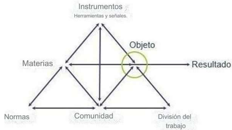
Figura 2. Sistema de actividades. Engeström, 2016.

Luego de esta primera capa, se agregaron los elementos de la parte inferior del triángulo, desde el momento en que la colectividad humana cobró protagonismo, considerando que el ser humano es un ser que se constituye en sociedad (Vygostki, 1991). A partir de esto, las prescripciones dichas y tácitas se categorizaron como reglas, las organizaciones sociales del trabajo se caracterizaron como división del trabajo y la interacción entre el sujeto y los demás sujetos se denominó comunidad (figura 2).