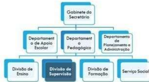
Figura 1. Estrutura Jerárquica del Departamento de Educación de Limeira/SP. Elaborado por los autores.