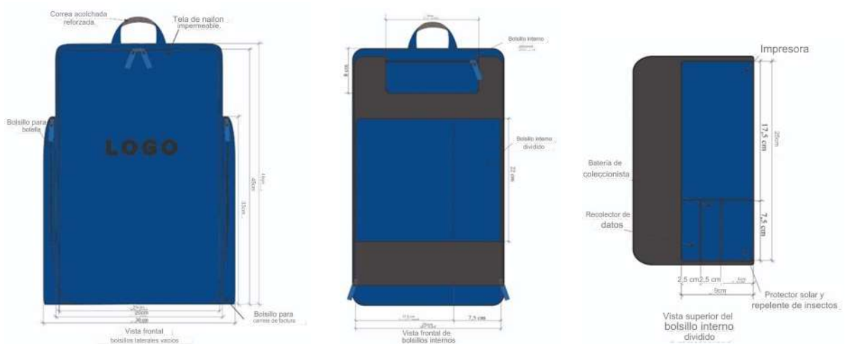
Figura 9 - Mochila de los Agentes de Relaciones Comerciales

La primera versión de la mochila es un prototipo comercial de baja fidelidad con un enfoque en la funcionalidad, desarrollado para ser un esbozo inicial de recomendaciones y proporcionar un producto visualizado: ➡ idea-producto.