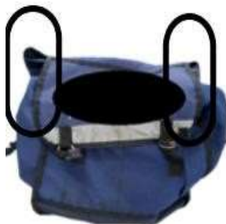
Figura 2 - Abertura en los laterales de la mochila

"No es una mochila con cremallera, por lo que su boca es ancha y se mantiene abierta, dependiendo de la postura que tome, si bajo a poner un billete, un billete por debajo de la puerta, por ejemplo, corre el riesgo de los productos que están dentro, como equipos de seguridad, protector solar, alcohol en gel, se caen de la mochila e incluso de la propia factura. La botella de agua ya se ha caído". (Agente 02)