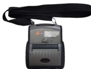
Figura 5 - Impresora

La impresora utilizada para imprimir facturas está interconectada con el colector de datos y puede imprimir una factura a la vez (una función que se usa generalmente después de leer los medidores de la casa) o un lote de facturas (una función que generalmente se usa después de leer los medidores del edificio), además de la función de reimpresión de facturas. Los rollos de facturas están acoplados a la impresora, lo que da como resultado la impresión de 90 facturas cada uno.