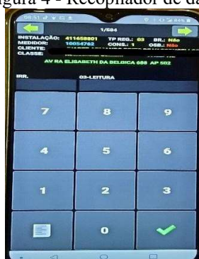
Figura 4 - Recopilador de datos