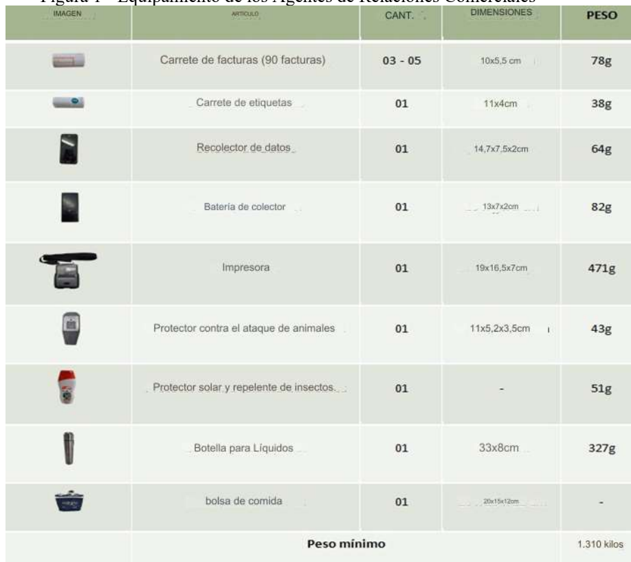
Figura 1 - Equipamiento de los Agentes de Relaciones Comerciales

laboral de 8 horas si se llevaba todo el equipo. A este peso hay que sumar el peso de los enseres personales y alimentos que cada agente lleva consigo.