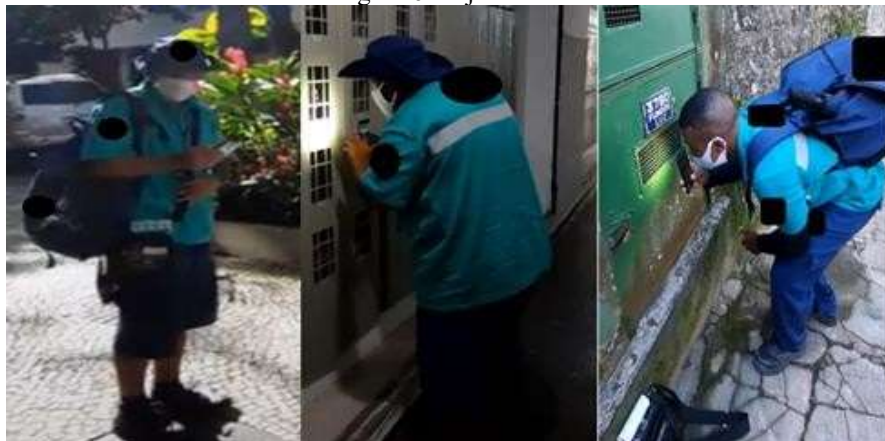
Figura 6 - Ajustes

También se registraron algunas normas, como el uso de la mochila intercalada con los hombros, la mochila dejada en la entrada de los edificios y la impresora colocada en el suelo. Estas regulaciones se muestran en la siguiente figura.