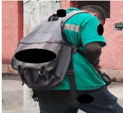
Figura 3 - Mochila con pocos objetos en su interior

"La mochila por sí sola, si no tiene nada ahí, la levantas y es liviana, pero te quedas boca arriba todo el día es pesada, ¿sabes?" (Agente 03)