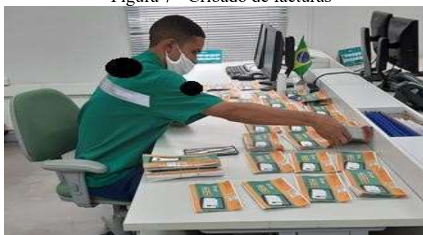
Figura 7 - Cribado de facturas

Los agentes también realizan la actividad de picking y entrega de facturas que ya han sido impresas. Estas facturas se refieren a contadores electrónicos con chip, que envían los datos de consumo directamente a la empresa de servicios públicos.