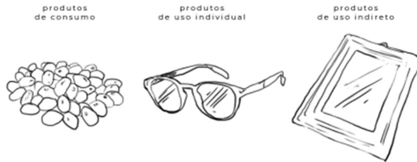
Cifra 2. Tipos de productos.

la figura 3 presenta algunos ejemplos de artefactos muebles del grupos carro fruta y carros de merienda, observar este tipo de artefacto toma el trabajador el mantener uno postura en pie poner tiempo prolongado, no hay uno asiento de descanso o a la variación de posturas ocupacionales.