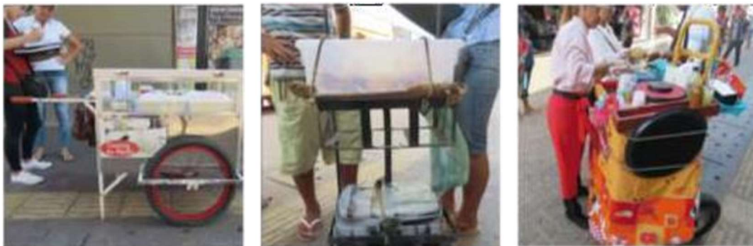
Cifra 3. Vendedores con artefactos muebles.

la figura 3 presenta algunos ejemplos de artefactos muebles del grupos carro fruta y carros de merienda, observar este tipo de artefacto toma el trabajador el mantener uno postura en pie poner tiempo prolongado, no hay uno asiento de descanso o a la variación de posturas ocupacionales.