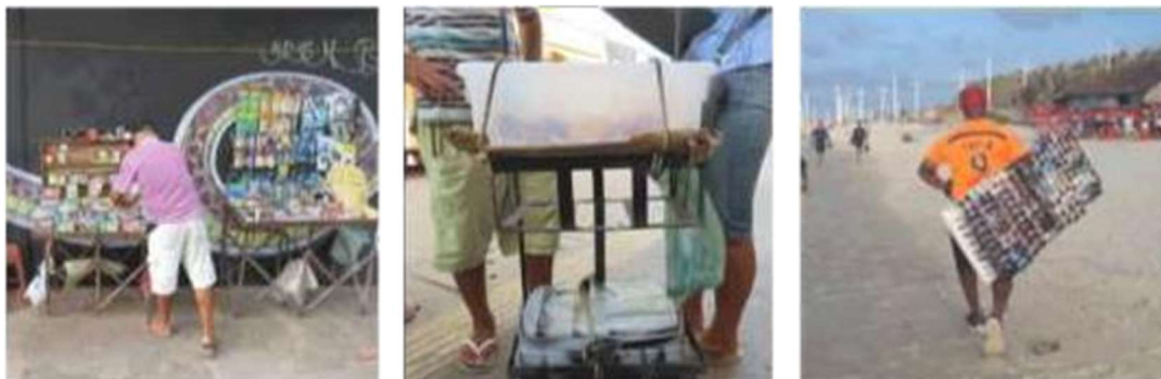
Cifra 3. Vendedores con artefactos fijado.

En artefactos fijos, donde en la mayoría de los sucesos registrados, además del paso del vendedor también muy tiempo en postura en pie, el dimensión de artefacto contribuye a problemas a largo plazo (figura 4).