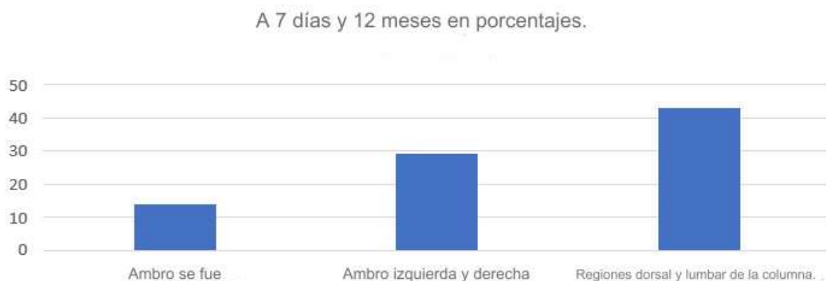
Cifra 4: Resultado desde el solicitud del cuestionario nórdico, en el plazo en 7 días y 12 meses.

Los resultados del Diagrama del Dolor arrojaron que existen malestares moderados en las regiones de los hombros, la espalda y las piernas. Se aplicó el Cuestionario Nórdico con el objetivo en identificar síntomas músculo esquelético en el término en 7 días Es en 12 meses. Contestada por el quince trabajadores del sector de corte, el resultado indicó que las áreas con mayor número de síntomas Ellos eran hacia regiones del espalda, columna dorsal Es columna espalda baja. Tú síntomas identificados en la región del hombro indicaron el quince por ciento de los trabajadores, en los últimosdoce meses. En cuanto a la región de la columna, no hubo extirpación. La figura 4 presenta la datos recogido de del cuestionario.