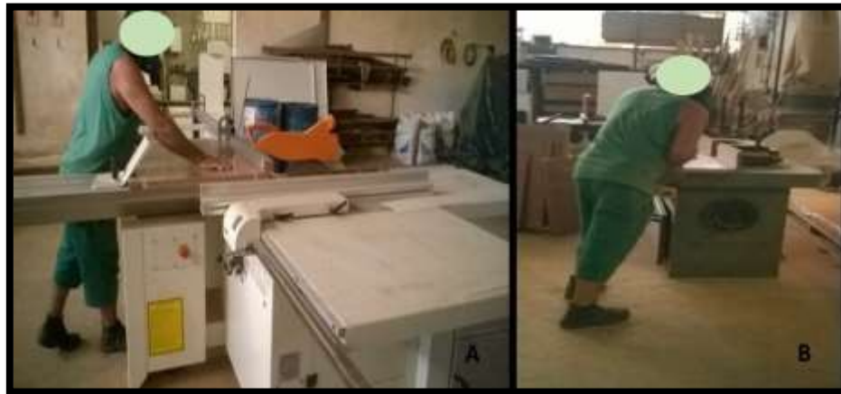
Cifra 3: (A) Postura en la colina cuadrado circular; (B) postura en Tupia.

La postura adoptada durante la ejecución de las acciones merece atención en el corto plazo. figura 3 presenta El ejecución de tarea en ambas máquinas.