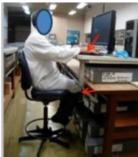
Figura 2: Visão da bancada atual de análise de testemunhos

As bancadas são fixas, e cada uma delas apoia sobre si uma mesa rolante situada 20cm acima de sua superfície, alimentada por barramento elétrico, conforme sinalizado nas figuras 2 e 3. Esta mesa acomoda CPU, monitor, teclado, mouse e microscópio, e pode se deslocar de uma extremidade a outra da bancada. Esse mobiliário, bancada e mesa, apresenta quina viva e não permite o ajuste de sua altura. Entre as bancadas existem cadeiras de modelo alto, sem apoio de braços, mas com apoio dos pés e com regulagem de altura do assento e do apoio lombar.