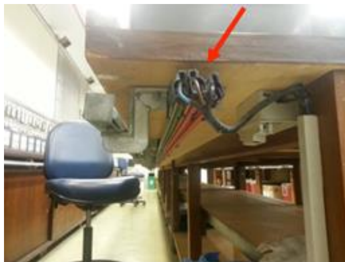
Figura 3: Visualização inferior de bancada e barramento elétrico associado

Nota-se, com isso, que em virtude da diferença de nível existente entre as superfícies das bancadas e das mesas rolantes, o encaixe dos membros inferiores sob as bancadas fica condicionado ao ajuste da altura do assento da cadeira destinado ao desenvolvimento de atividades sobre sua superfície, mas prejudicando o posicionamento adequado dos braços, caso necessite utilizar o teclado do computador. Ao contrário, se a atividade é com o computador, situado sobre a mesa rolante, a cadeira deve ter outra regulação de seu assento, acomodando os membros superiores em detrimento dos membros inferiores. Além disso, não há apoio para os braços quando da utilização do mouse e do teclado.