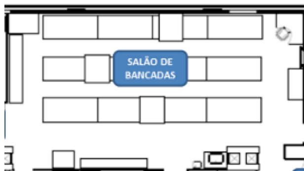
Figura 4: Leiaute atual do Setor de Sedimentologia e Estratigrafia