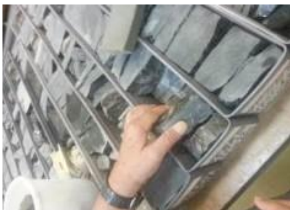
Figura 1: Caixas de Testemunhos para análise

É realizada análise visual às rochas, a olho nu e com o auxílio de lupas e fluoroscópio e classificação de acordo com critérios técnicos, inserindo os dados no sistema informatizado AnaSeTe. Na figura 1, observa-se caixas de testemunhos a serem analisadas.