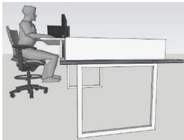
Figura 6: Simulação de proposta de bancada para análise de testemunhos (visão lateral)

A proposta tem como principais características a extensão do tampo da mesa, como visualizado nas simulações das figuras 1 e 2, permitindo melhor acomodação dos membros inferiores e manutenção da visão total das caixas de rocha.