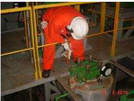
Figura 1. Simulação do acidente

No segundo evento, o trabalhador, ao realizar o fechamento de uma válvula, perdeu o equilíbrio e caiu do patamar de 40 cm de altura, sofrendo uma contusão com desalinhamento do punho e escoriação na região anterior do braço. Durante a análise do acidente, notou-se a necessidade de aplicação de força maior devido à pressão interna do sistema e que a válvula se encontrava instalada a uma altura de 2,15m da base do skid (local de manobra da válvula). No entanto, em função do espaço limitado para apoiar os pés, o operador sofreu a queda. Dentre as ações corretivas adotadas, está a instalação de piso grade nivelando os pisos dos skids e a instalação de dispositivo de prolongamento da haste, de forma que o operador consiga realizar a