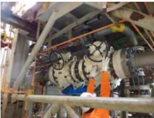
Figura 4. Acesso inadequado 02