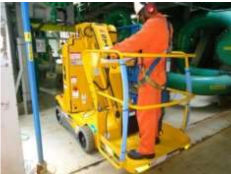
Figura 5. Plataforma automatizada

Outra alternativa é a utilização de válvula operada com auxílio de correntes, conforme a figura 6. Esse tipo de válvula é utilizado em grande escala em áreas industriais que apresentam pouca disponibilidade de espaço para instalação de acesso.