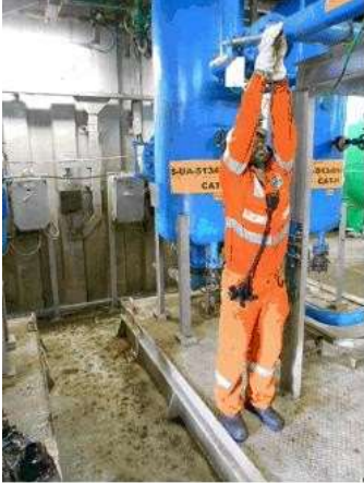
Figura 2. Localização da válvula em relação ao skid

Nos eventos analisados, podemos constatar que, quando o projeto é concebido com falhas, o trabalhador cria alternativas para a execução da tarefa. Os eventos elencados são algumas demonstrações com consequências indesejadas de problemas conhecidos. Nas figuras 3 e 4, há exemplos de outros pontos de operação em locais de difícil acesso. Diante desse cenário, o profissional de segurança deve ter atuação decisiva em todo local de trabalho onde não existem meios de acesso apropriados, seja pela recomendação de instalação de mecanismos de correntes em válvulas, acessos permanentes ou provisórios (andaimes) ou utilização de plataformas automatizadas.