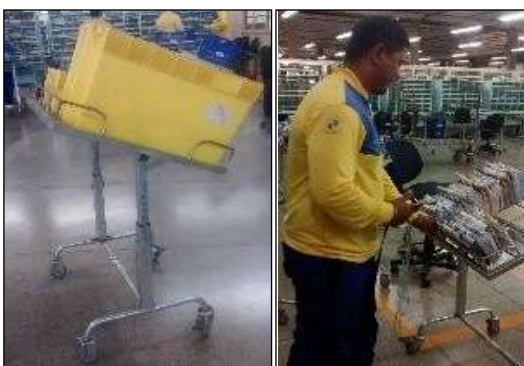
Figura 3: Carrinho – Suporte para Caixaeta.

Tem-se também como parte integrante das melhorias ergonômicas o Carrinho – Suporte para Caixaeta, equipamento que possui regulagem na altura com inclinação fixa que permite a colocação de caixaetas próximas ao manipulador de triagem, evitando-se movimentos extremos e frequentes. A implementação deste facilita o acesso aos objetos a serem triados, evitando movimentos de flexão e rotação do tronco. O Carrinho também pode ser utilizado para o transporte em pequenos deslocamentos e posicionamentos das caixaetas nos postos de trabalho, conforme a Figura 3.