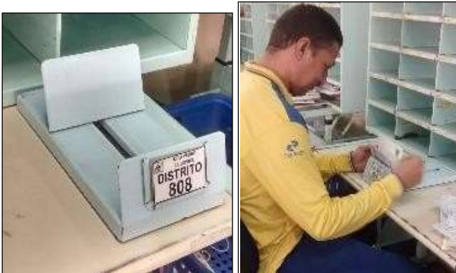
Figura 4 - Ordenador de Correspondência – OC-01(Manipulador).

auxiliando no trabalho dos profissionais. A base deve possuir um rasgo para encaixe e deslocamento do anteparo móvel.