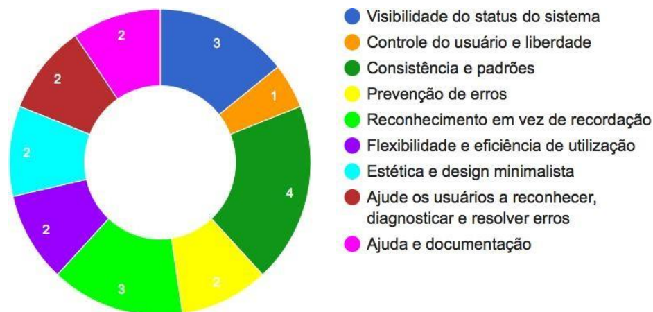
Figura 2 Número de problemas por princípio

A análise da avaliação heurística indicou um total de 21 problemas distintos (Figura 2), 5 percebidos por ambos avaliadores e 1 em duplicidade pelo avaliador A, categorizado em princípios distintos, totalizando 27. Dos 5 comuns, apenas 1 problema foi relacionado com o mesmo princípio “consistência e padrões”. Ainda em “consistência e padrões”, o Avaliador A relacionou um problema que foi desmembrado pelo Avaliador B em 2 e categorizados como “estética e design minimalista”. Ademais, o Avaliador A correlacionou 1 problema como “ajuda e documentação” e o mesmo problema foi classificado como “consistência e padrão” pelo Avaliador B.