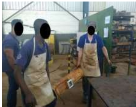
Cifra 1 – Cargando manual en motores doble

De esta manera, cada vez que uno de ellos necesita transportar una pieza o motor, solicita asistencia a uno de sus compañeros y luego el transporte se realiza en parejas, sin el intermediario del puente móvil. Semejante estrategia, genera, segundo El visión del mecánica, uno avance del servicio es un aumentar en su calidad, ya qué oh tiempo gastado con El operación desde el puente móvil él era salvado Es el riesgo en daño del sistema eléctrico disminuido (Figura 1).