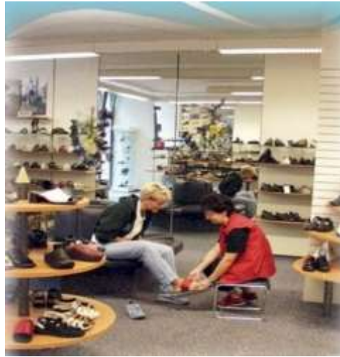
Figura 5 – Postura adequada com auxílio de banco.