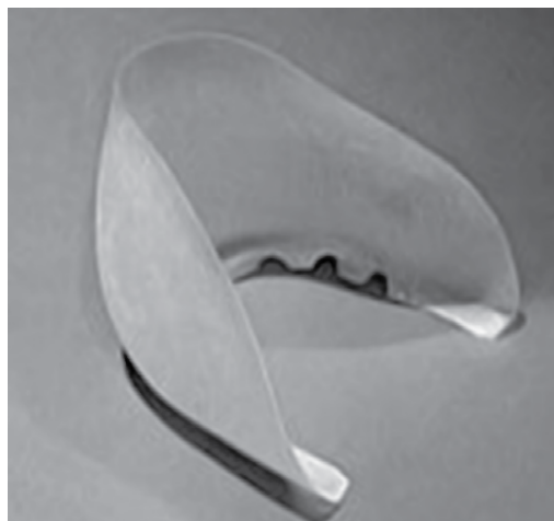
Figura 2. Contraforte injetado convencional.

Há dois tipos de contraforte: laminado e injetado – este artigo aborda o injetado. Denominou-se de contraforte convencional o contraforte injetado produzido com polímeros rígidos, geralmente poliolefinas como PEBD, TR ou PVC, e processos convencionais; denominou-se de contraforte reprojeto o contraforte injetado elaborado por aplicação do ecodesign no reprojeto. Na confecção do contraforte injetado, o composto ou matéria-prima termoplástica é fundido e transportado por pistão ou rosca para, por pressão, preencher a cavidade de um molde específico. Tal processo permite que o contraforte seja injetado no tamanho e formato desejado pela modelagem, em função do molde utilizado. A Figura 2 ilustra o contraforte injetado convencional.