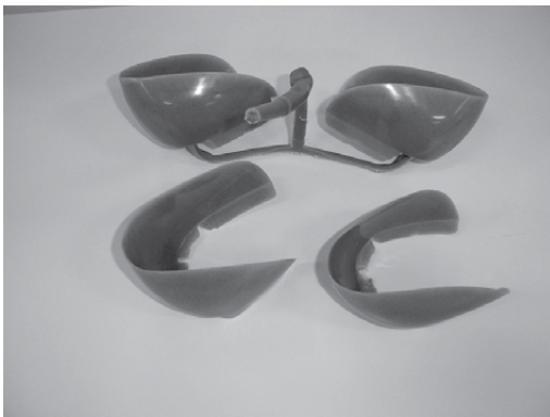
Figura 3. Contraforte injetado reprojetoado.

Observa-se que o uso do contraforte reprojetoado gera uma diminuição de aproximadamente 30% no custo-alvo operacional (custo minuto de processo) do processo de aplicação do contraforte no cabedal, pela redução dos tempos nas operações. No custo-alvo final de aplicação do contraforte reprojetoado no cabedal, incluindo os insumos necessários, observa-se uma redução em torno de 10% comparativamente ao uso do contraforte convencional. Além disso, os solventes, halogenantes e adesivos base solvente empregados no processo de produção do contraforte injetado convencional são insalubres e representam aproximadamente 50% dos custos com insumos. Na aplicação do contraforte reprojetoado no cabedal, deixam de ser utilizados solventes, primer , adesivo hot melt e adesivo base solvente.