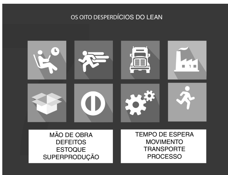
Figura 5 Os oito desperdícios do Lean.

LSS em centro de cardiologia invasiva, Lin et al. (2013) na otorrinolaringologia, Ciulla et al. (2017) na clínica oftalmológica. 16-18