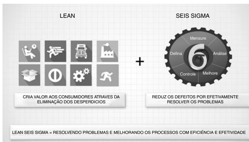
Figura 4 Metodologia Lean+Seis Sigma.

causa raiz das atividades que não agregam valor, bem como seus custos;