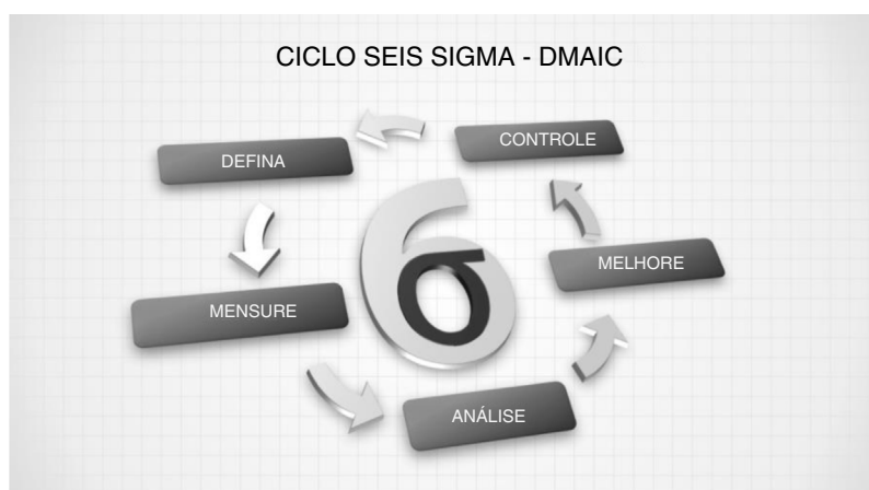
Figura 2 Ciclo Seis Sigma DMAIC.

empresa que têm níveis hierárquicos diferentes, representados por faixas coloridas ( belts ), como as usadas nas artes marciais. Quanto mais escura a faixa, mais avançado é o seu nível e grau de maturidade para aplicar o processo do gerenciamento da qualidade (fig. 1).