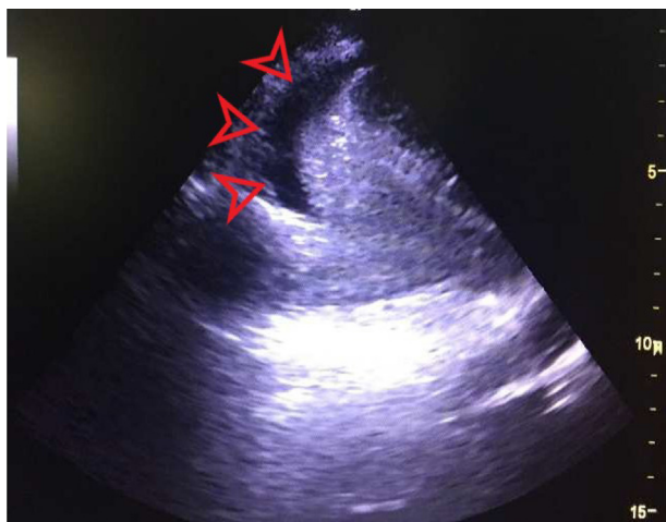
Figura 2 Ecocardiograma transtorácico intraoperatório. Pontas de setas: derrame pericárdico.

tamponamento cardíaco foi levantada. Um ecocardiograma transtorácico intraoperatório foi feito, identificou derrame pericárdico circunferencial de 25 mm com compressão diastólica do átrio direito (fig. 2). A equipe de cirurgia cardíaca foi contatada e uma janela pericárdica subxifoide foi feita, na qual hemopericárdio grave foi visualizado com abundantes coágulos. A esternotomia mediana foi concluída, extraiu vários coágulos e uma grande quantidade de sangue e excluiu a presença de perfuração de cavidades cardíacas ou qualquer lesão de grandes vasos. Após a drenagem pericárdica, a condição da paciente melhorou clínica e analiticamente, reverteu-se a acidose metabólica (pH 7,32; pCO 2 42,9 mmHg; pO 2 235 mmHg; bicarbonato 21,2 mmol.L -1 ; excesso de bases -4 mmol.L -1 ) e o suporte vasoativo pôde ser interrompido. Cinco unidades de hemácias, duas unidades de plasma fresco congelado, 2 g de fibrinogênio, 1 g de ácido tranexâmico e 500 UI de complexo protrombínico foram transfundidos e o sangramento intraoperatório de 1.500 mL foi estimado.