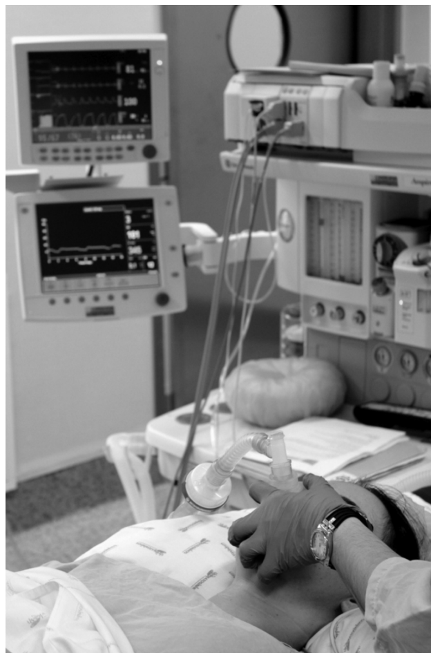
Figura 1 Doente na Unidade de Ambulatório, sob sedação profunda, para infiltração de pontos gatilho. Durante o procedimento foi usada a monitoração considerada padrão pela American Society of Anesthesiologists.

No dia do procedimento, após a chegada ao bloco, a doente foi pré-medicada com 0,05 mg de fentanil e 1 mg de midazolam endovenosos (EV) e colocada em posição ginecológica. Posteriormente foi anestesiada com bólus de propofol, num total de 270 mg EV. Depois da desinfecção apropriada, a espinha isquiática (EI) e o ponto de inserção do ligamento sacroespinhoso foram identificados por via