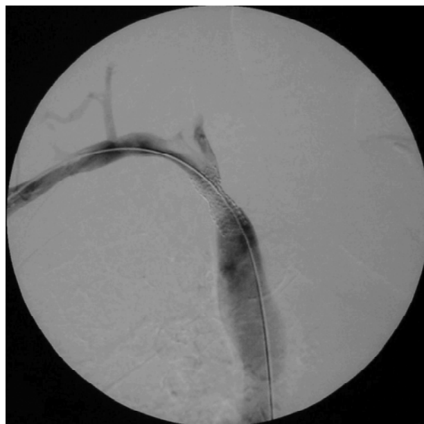
Figura 3 - Flebografia de controle