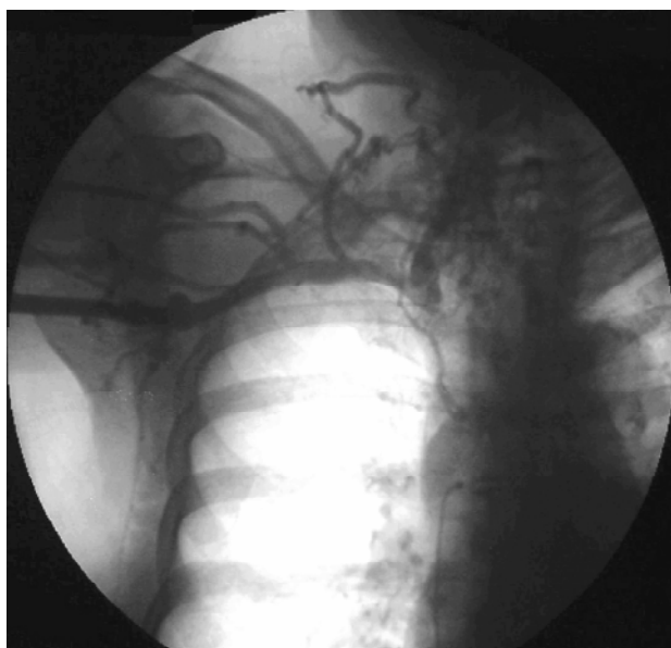
Figura 1 - Flebografia pré-operatória

Após o diagnóstico clínico de SVCS, a paciente foi submetida a uma angiorressonância para estudo anatômico do caso e planejamento terapêutico. O exame demonstrou extensa trombose do tronco braquiocéfálico (TBC) esquerdo, da veia subclávia esquerda e obstrução da VCS junto ao TBC direito (Figura 1).