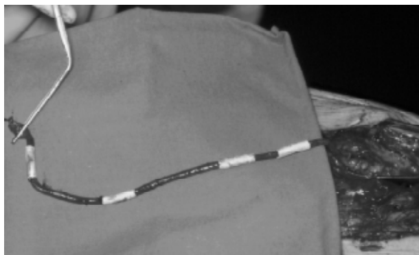
Figura 2 - As quatro dilatações foram recobertas

ro com um balão de 3 mm. Não foi possível, no entanto, descer o balão à artéria tibial anterior. A oclusão da ponte deveu-se à deficiência de um leito distal, e não à técnica de revestimento.