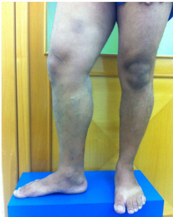
Figura 2. Membros inferiores com paciente em posição ortostática, vista frontal, evidenciando assimetria do membro inferior direito.

anatômicas. O exame físico fornece ferramentas para a construção do diagnóstico de IVC, mas não é suficiente para detectar as estruturas envolvidas e a extensão da lesão. Com isso, o exame inicial da investigação, o ultrassom vascular com Doppler, que foi solicitado neste caso, oferece análise anatômica e hemodinâmica das estruturas vasculares envolvidas, auxiliando no diagnóstico e na diferenciação dos