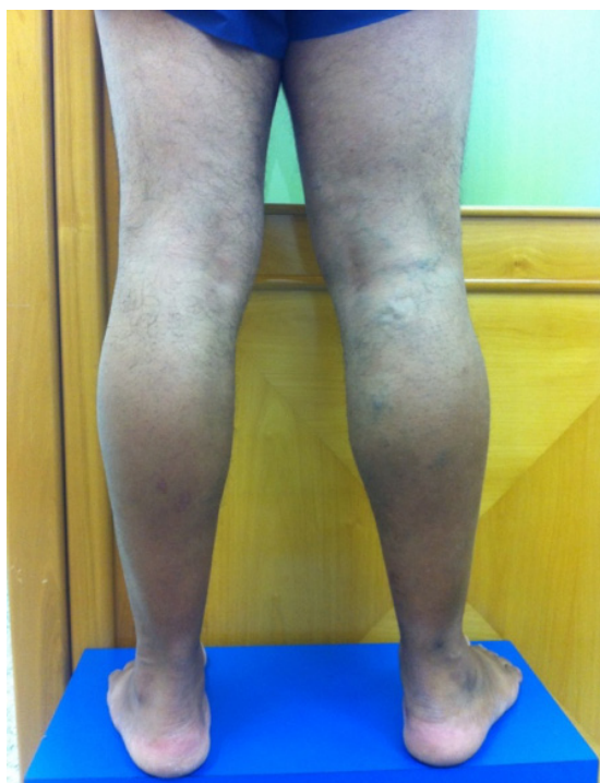
Figura 3. Membros inferiores com paciente em posição ortostática, vista dorsal, evidenciando varizes em perna proximal.

anatômicas. O exame físico fornece ferramentas para a construção do diagnóstico de IVC, mas não é suficiente para detectar as estruturas envolvidas e a extensão da lesão. Com isso, o exame inicial da investigação, o ultrassom vascular com Doppler, que foi solicitado neste caso, oferece análise anatômica e hemodinâmica das estruturas vasculares envolvidas, auxiliando no diagnóstico e na diferenciação dos