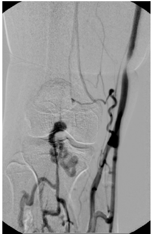
Figura 7. Flebografia ascendente mostrando veias profundas de perna com drenagem anômala para veia safena magna. Não foi visualizada a veia poplítea.