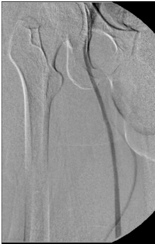
Figura 6. Flebografia ascendente mostrando veia safena magna e veia femoral comum. Não foi observada a veia femoral neste segmento.

Quase todas as malformações vasculares se beneficiam com tratamento compressivo, adequado, monitorizado e iniciado desde cedo, que evita uma piora progressiva