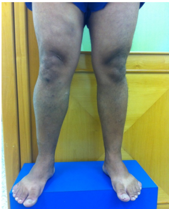
Figura 1. Membros inferiores com paciente em posição ortostática, vista frontal, evidenciando assimetria do membro inferior direito.

difícil e o paciente permanece por longos períodos com tratamento errôneo de outra doença vascular, que pode apresentar sintomas semelhantes aos de anomalias